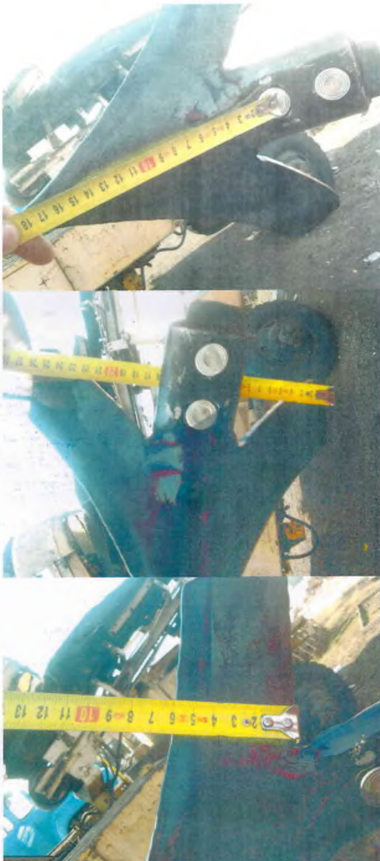
Фото образец №1 от 15.04.2016