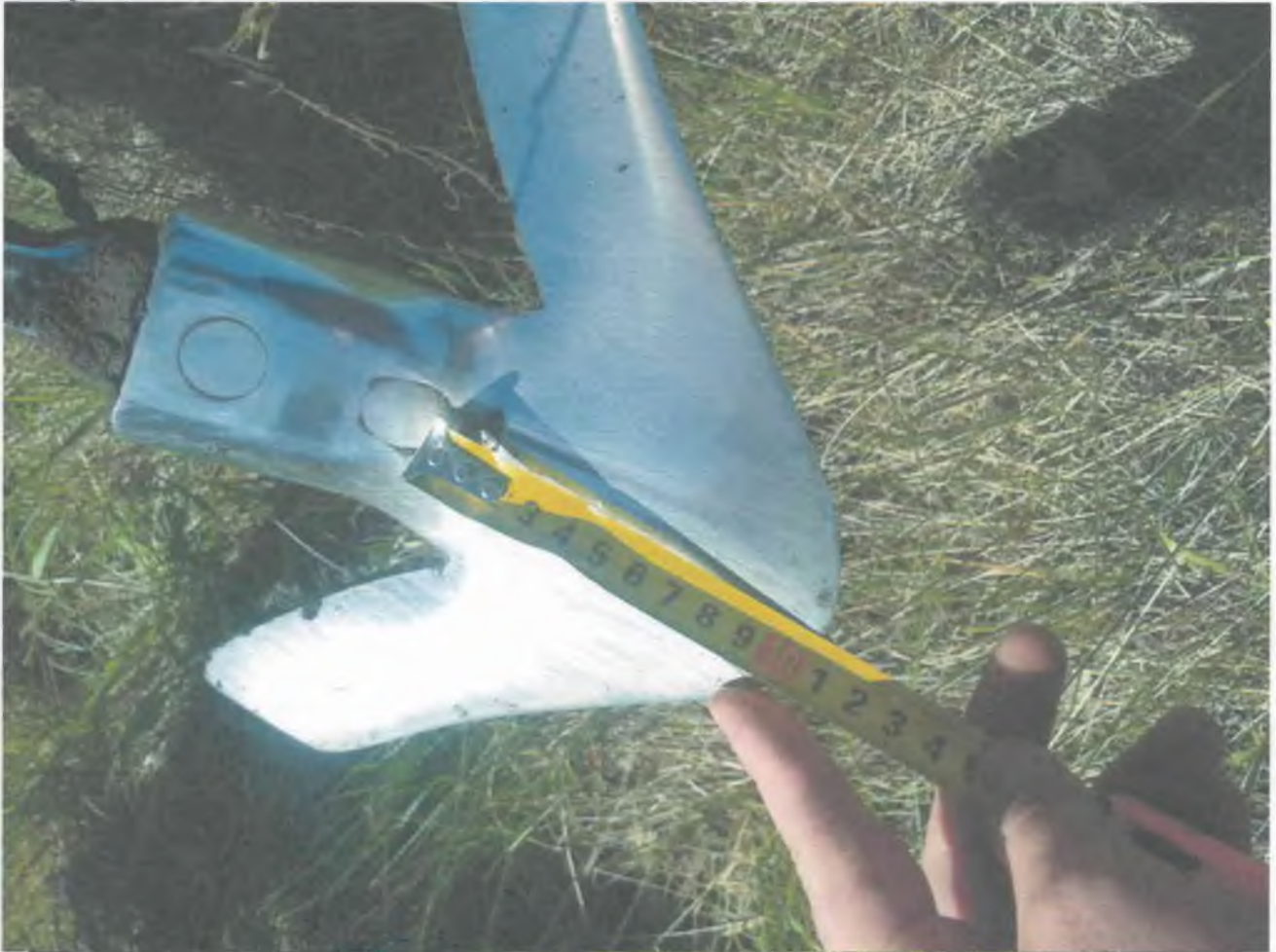
Фото образец №1 от 21.05.2016