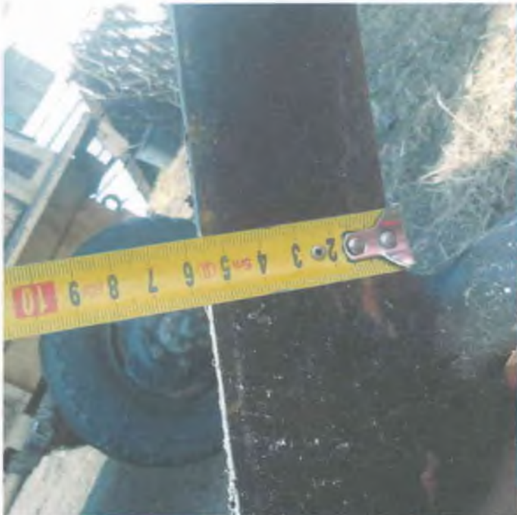
Фото образец №2 от 15.04.2016