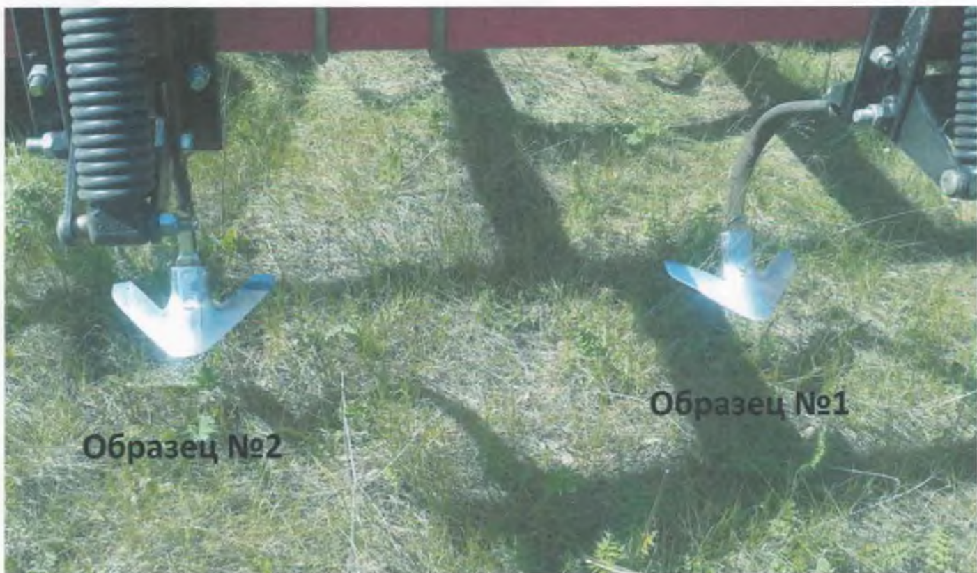
Фото образцов общий вид 20.05.2016