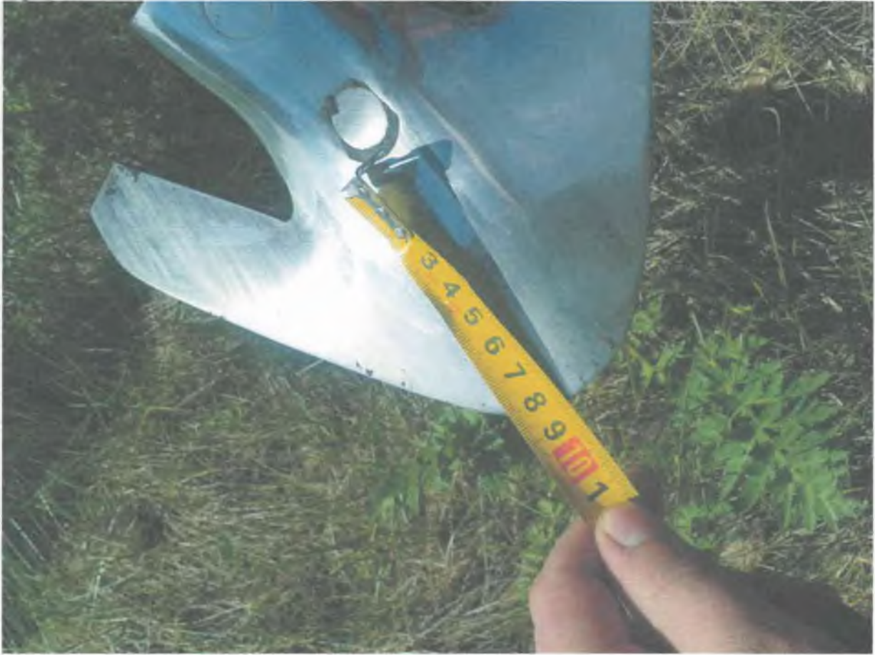
Фото образец №2 от 21.05.2016